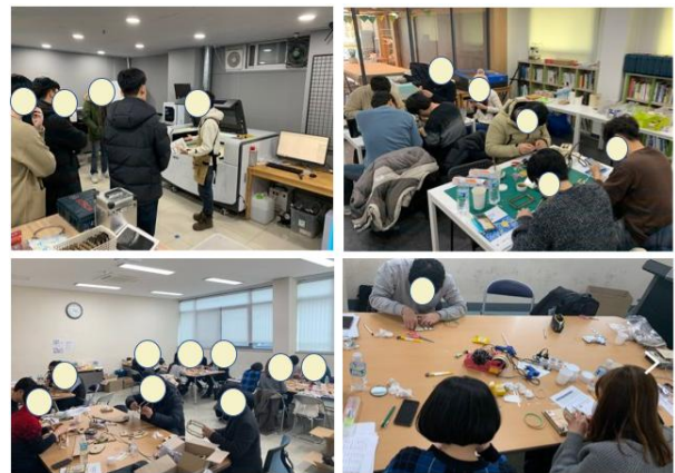
Fig. 3. Pictures of the implementation of the teacher training program

개발된 메이커 교육 연수 프로그램은 초등교사 19명을 대상으로 하여 2일간의 집합 연수의 형태로 적용하였다. 집합 연수는 2020년 1월 14일부터 1월15일까지 2일간 총 15시간 동안 이루어졌으며, 연수 장소로는 1일 차는 G 교육대학교 교육연수원의 첨단 강의실을 활용하였고, 2일 차는 G 교육대학교 인근 메이커 스페이스를 통해 연수를 진행하였다. 첨단 강의실과 메이커 스페이스를 통해 이루어진 교사 연수의 활동 모습은 Fig. 3과 같다.